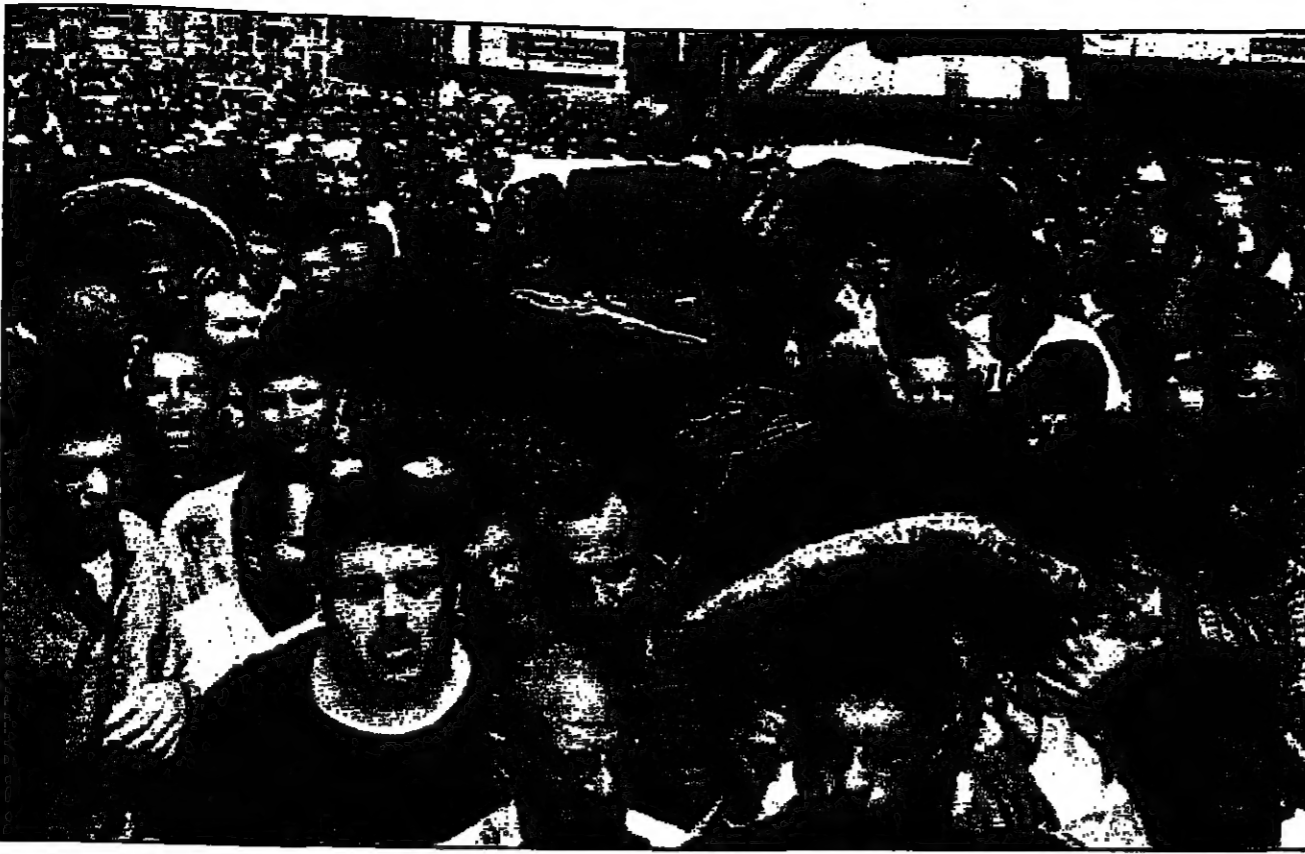
الآلاف من سكان صيدا يشبهون يوم لوزن من الضحايا الذين تتهم القنصل الإسرائيلي أمس الأول